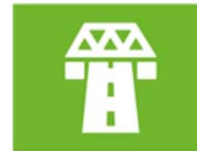
ruimte en infrastructuur