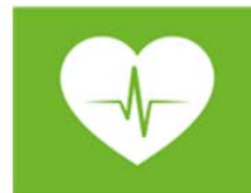
zorg en gezondheid