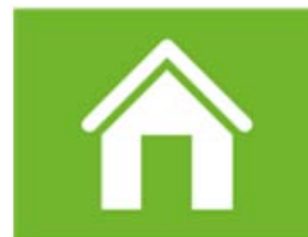
wonen en woonomgeving