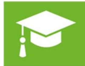
onderwijs en vorming