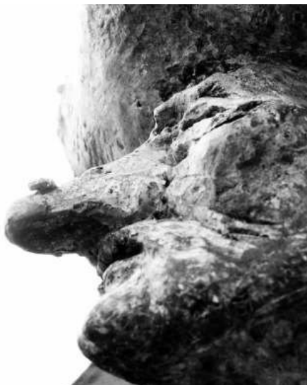
Eén van de heksen vereeuwigd in beeld