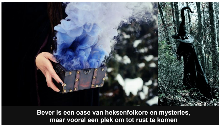
Bever is een oase van heksenfolklore en mysteries, maar vooral een plek om tot rust te komen

dat wanneer u de schat vindt, de inhoud ervan kan gewijzigd worden door een speeltje te ruilen met dezelfde of een hogere waarde. Geniet van de wandeling en hou het vooral plezant!