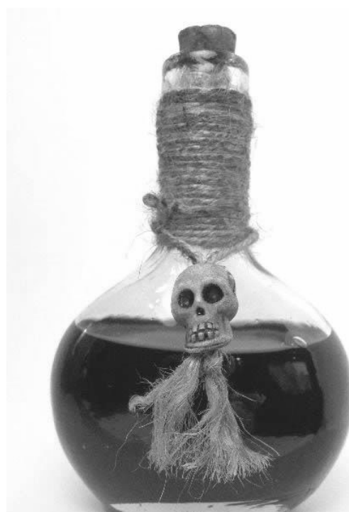
Heksen zijn gekend om hun heksendranken.

Religieuze vervolging van vermeende heksen nam pas een aanvang in de 14e eeuw. In het Europa van de vroege 15e eeuw kreeg men over hekserij angstbeelden: de heks bevriendt met de duivel. Het geloof dat heksen leden waren van een geheimzinnige duivelse sekte leverde de basis voor grootschalige vervolgingen. Processen, veroordelingen en executies werden gemeengoed in heel Europa en bereikten een hoogtepunt tijdens de 16e en 17e eeuw.